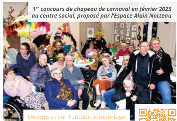
1 er concours de chapeau de carnaval en février 2025 au centre social, proposé par l'Espace Alain Notteau

Découvrez sur Youtube le reportage de France 3 Nord Pas-de-Calais, « Santé mentale : le carnaval, la saison préférée de l'EPSM »