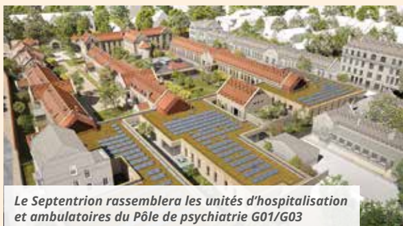
Le Septentrion rassemblera les unités d'hospitalisation et ambulatoires du Pôle de psychiatrie G01/G03

En effet, en optant pour ce nouveau lieu de soin, l'EPSM des Flandres inscrit cet ancien hôpital du quartier de Rosendaël dans un futur proche en lui redonnant sa vocation de soin. Ce futur chantier dont le permis de construire est actuellement déposé s'annonce d'envergure. Le Septentrion regroupera les centres de soins La Tonnelle, la Clinique Psychothérapeutique de Rosendaël, les appartements thérapeutiques du Dunkerquois. Puis d'autres structures