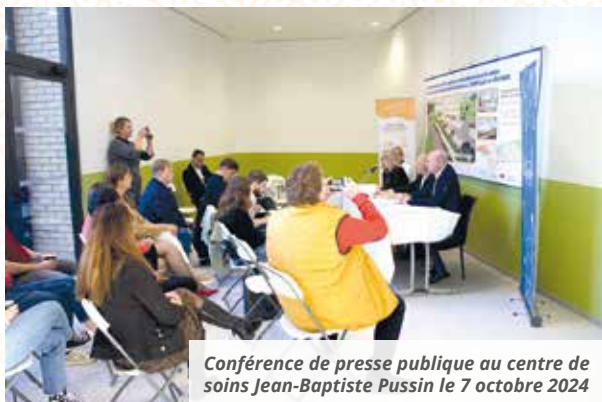
Conférence de presse publique au centre de soins Jean-Baptiste Pussin le 7 octobre 2024

« Le nouvel équipement qui se construit au fond de la cité des cheminots va regrouper l'ensemble des activités ambulatoires : « C'est-à-dire tous les soins qui sont alternatifs à l'hospitalisation. Il faut savoir quand même que sur 100 patients que nous suivons, il y en a 85 qui ne mettront pas les pieds à l'hôpital et qui seront suivis en ambulatoire. Le soin ambulatoire, c'est malgré tout beaucoup plus confortable pour tout le monde. Et puis surtout, ça évite au patient de se couper de son milieu naturel »