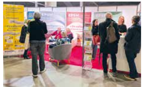
Congrès de la Société Française de Santé Publique du 5 au 7 novembre à Lille Grand Palais.

Afin de positionner la direction commune en tant qu'acteur majeur en psychiatrie et santé mentale, les EPSM Lille-Métropole, agglomération lilloise et Val de Lys-Artois œuvrent à accroître leur notoriété. Présents sur plusieurs colloques nationaux en 2025, au travers de stands attractifs, visuels et conviviaux, les directions sont parties à la rencontre de professionnels médicaux, paramédicaux mais aussi d'usagers. Projets innovants, actions de recherche, qualité de vie sur ses territoires, nos établissements ne manquent pas d'atouts pour déclencher des vocations et donner envie de rejoindre « un collectif au service de la santé mentale » !